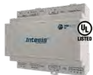
IN776MHIO0S0000 IN776MHIO0M0000 IN776MHIO0L0000