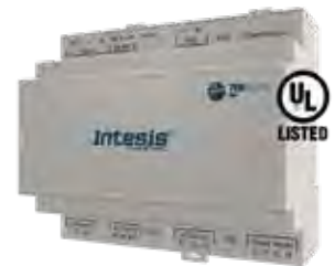
IN776MHIO0S0000 IN776MHIO0M0000 IN776MHIO0L0000