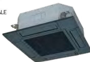
FDT 100-125-140 VH Pannello standard nero T-PSA-5BB-E