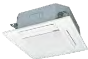
FDT 100-125-140 VH Pannello standard bianco T-PSA-5BW-E