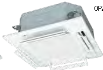
FDT 100-125-140 VH Pannello antidraift bianco T-PSAE-5BW-E