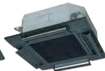
FDT 100-125-140 VH Pannello antidraift nero T-PSAE-5BB-E